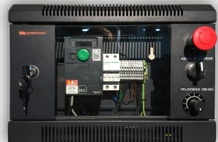
Cuadro de control