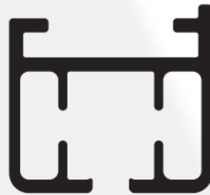
Sección del carril